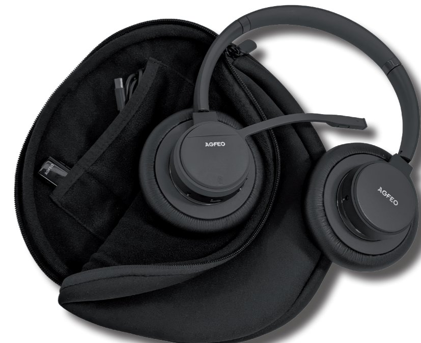
Abb. zeigt optional erhältliche große Ohrpolster